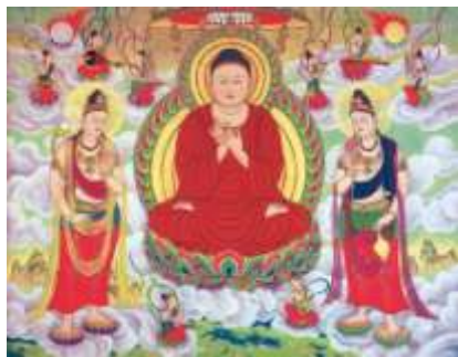
阿弥陀如来与二菩萨画像

阿弥陀佛是日本最受欢迎的佛。他受欢迎的程度甚至超过了佛祖释迦牟尼。 作为一位超时空的佛， 阿弥陀拯救一切对他有真诚信心并称其佛名的人们。阿弥陀以他的无量光摄受与保护如是信者， 并把他们接引至佛的极乐净土。还有以观世音 及大势至为首的诸菩萨们协助佛拯救众生。阿弥陀佛与这两位菩萨的塑像在日本及其他流行净土思想的亚洲国家中是非常普遍的。