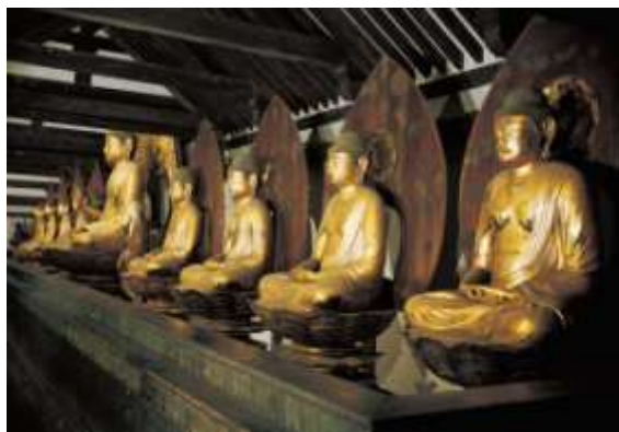
日本京都净瑠璃寺九体阿弥陀像。为藤原道长（966-1028）所建立。

当我们提到净土宗或净土佛教这两个名词时，我们不单单只是指在日本的净土学派。在中国、台湾、韩国、越南等亚洲国家以及欧洲，美洲亚裔移民的聚集地都存在各类净土学派。这些学派的佛寺与道场都是由当地的僧人或讲师所主持。